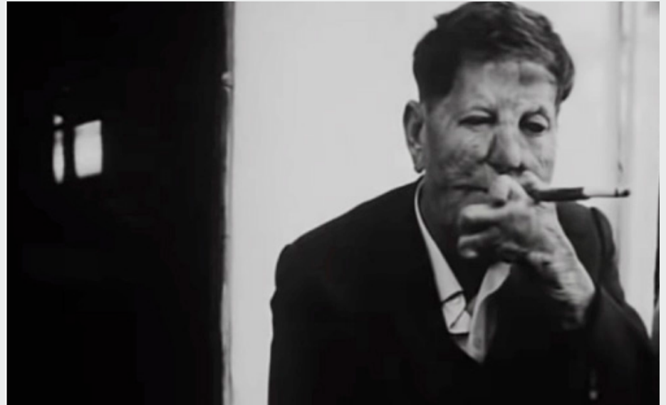
Photo de Raymondakis dans le film L'Ordre de Jean-Daniel Pollet en 1973

À partir de cette rencontre, j'ai voulu me lancer dans une interprétation libre et poétique de